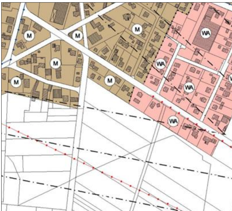
Abb. 1: Ausschnitt aus dem rechtswirksamen F-Plan der Samtgemeinde Bothel/ ohne Maßstab

Die sich südlich, südwestlich und östlich an das Änderungsgebiet anschließenden Flächen sind als Flächen für die Landwirtschaft dargestellt.