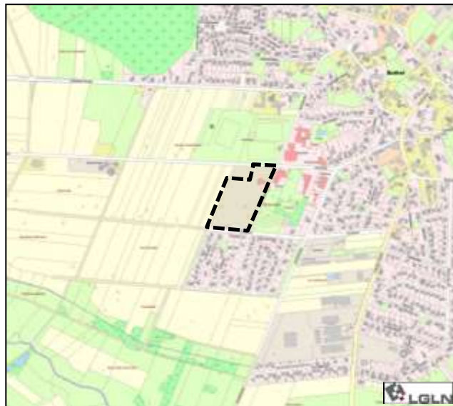
Abb. 1: : Lage des Plangebietes (Geltungsbereich gestrichelt umrandet)

Die räumliche Lage des Änderungsbereiches ist der nachfolgenden Abbildung zu entnehmen.